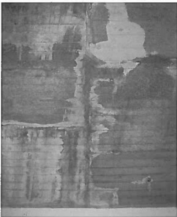
Figura 4: esempio di infiltrazione