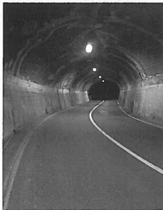
Figura 5: esempio di fessurazione rilevata nel rivestimento