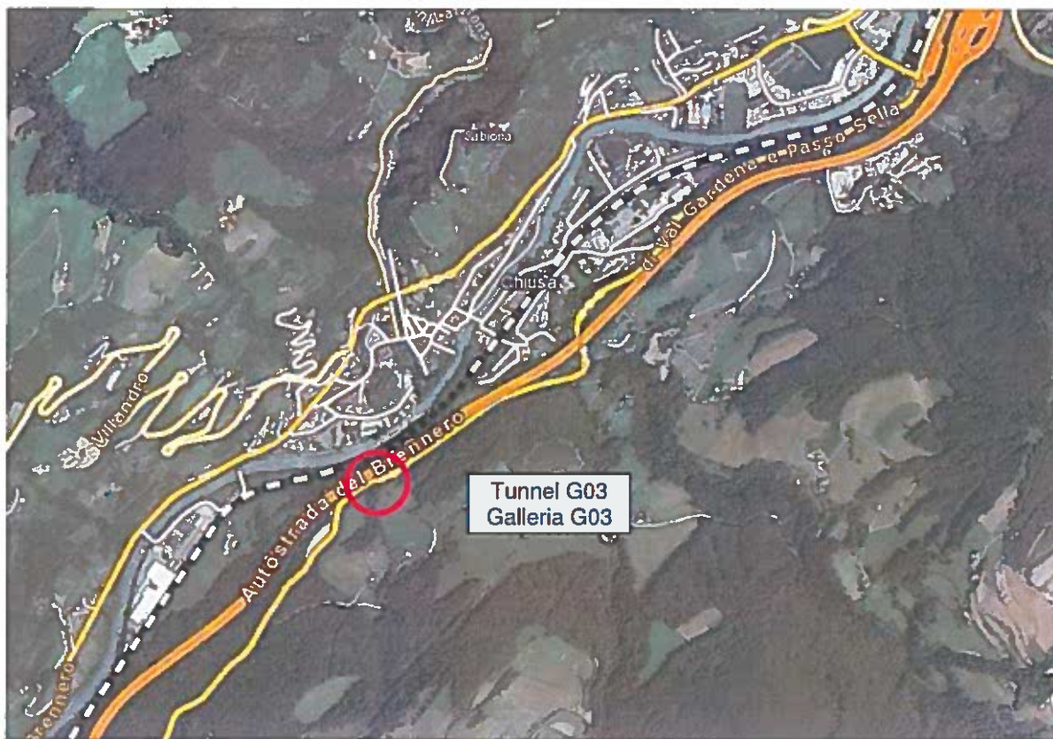
Figura 1: Inquadramento dell'opera