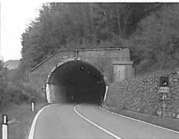
Figura 3: portale est