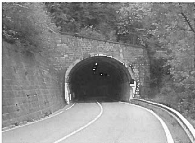
Figura 2: portale ovest