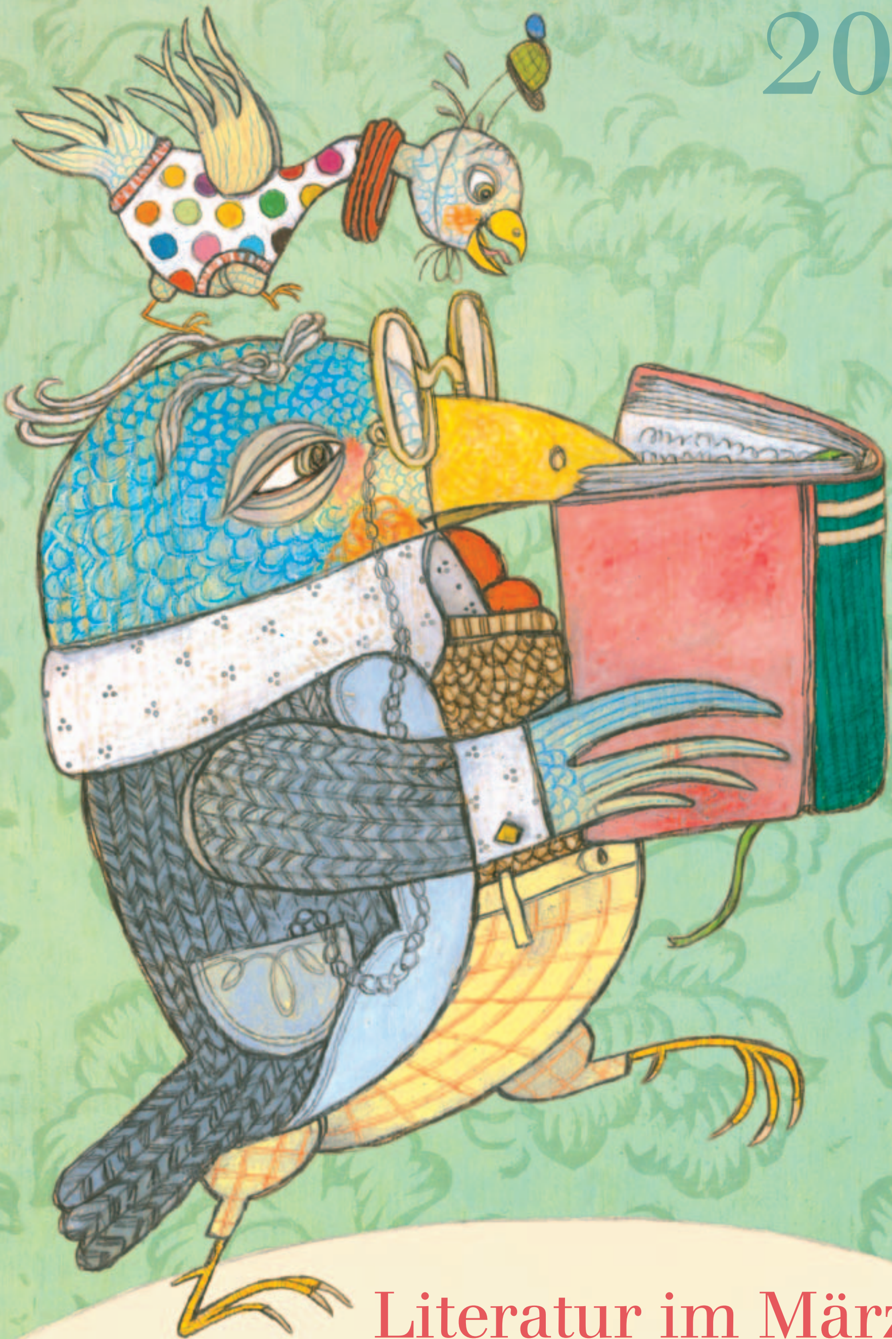
Illustration: Selda Marlin Soganci