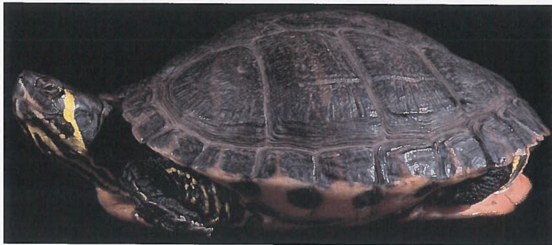
Tartaruga dalle orecchie gialle Trachemys scripta scripta