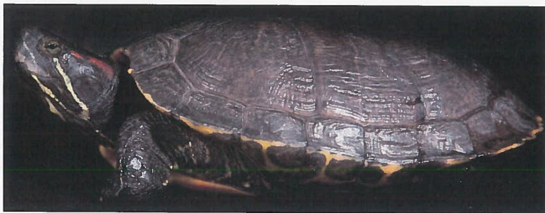
Tartaruga dalle orecchie rosse Trachemys scripta elegans

Un'altra sottospecie, molto simile alle tartarughe sopra riportate, è la Trachemys scripta troosti , con striscia gialla o arancione. Ma come già detto, nel modulo di denuncia basta riportare la specie, senza distinguere le sottospecie.