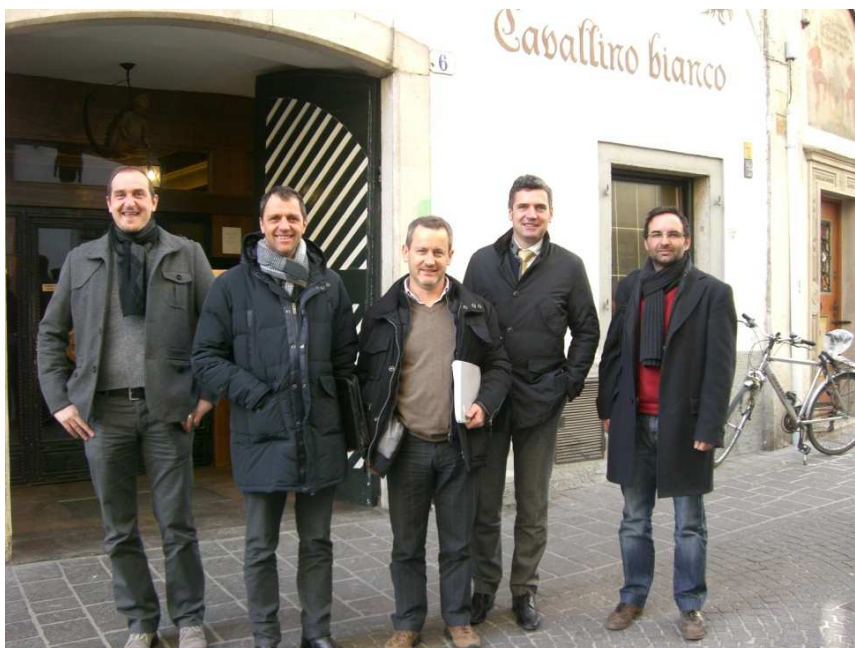
Incontro tra i GAL dell'Alto Adige e l'eurodeputato Herbert Dorfmann a Bolzano