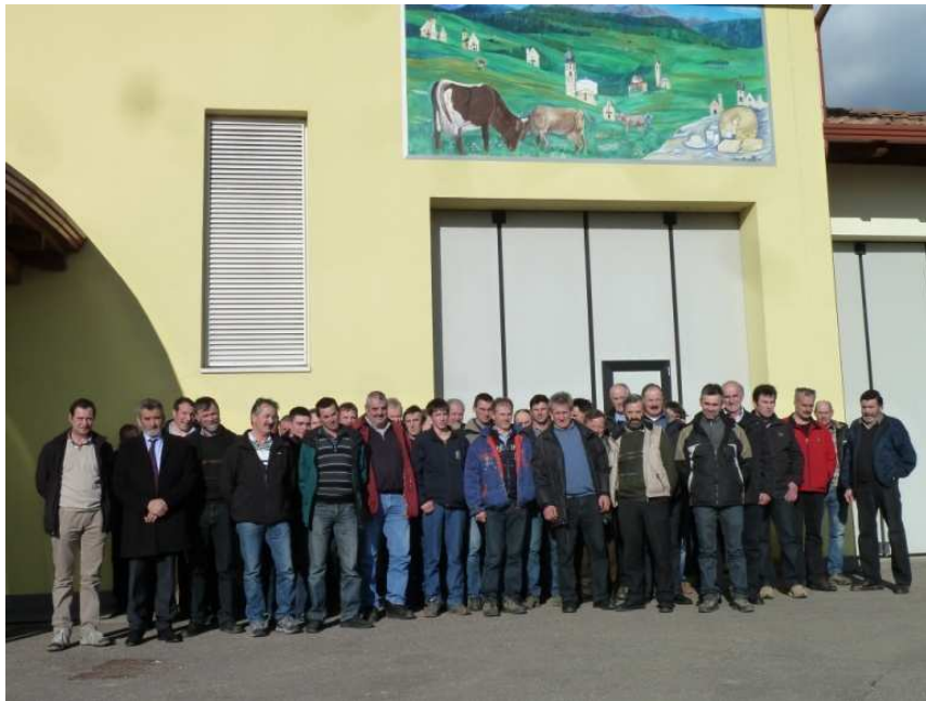
Il gruppo di lavoro della razza bruna in occasione della visita alla latteria sociale di Fondo (TN)

C'è da notare infine che sulla scia degli altri gruppi di lavoro portati avanti con notevole successo - sempre con mezzi del PSR - nel frattempo si è costituito un ulteriore gruppo di lavoro con lo scopo di incentivare la zootecnia in Val d'Ultimo. Scopo principale dei 30 allevatori riunitisi nel suddetto gruppo di lavoro è quello di permettere l'acquisizione di conoscenze ed esperienze sia nel settore vero e proprio della zootecnia (settore del latte e della carne), sia soprattutto nel conseguimento di competenze gestionali e burocratiche nella gestione delle aziende agricole. Tale acquisizione avverrà a prescindere dalle singole razze bovine presenti nella zona di progetto, anzi si tratta di un progetto di cooperazione che vede coinvolti tutte le federazioni di allevamento delle singole razze a livello provinciale e a livello locale. Tutti questi soggetti hanno supportato la nascita del gruppo di lavoro, che ha come zona di progetto i comuni della Val d'Ultimo nonché i comuni confinanti.