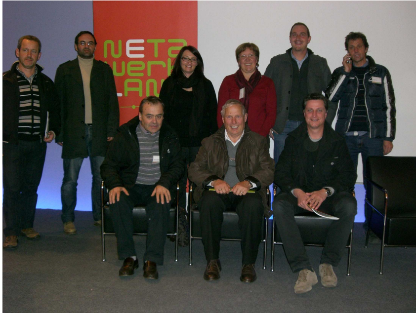
Foto di gruppo al convegno della Rete rurale austriaca Netzwerk Land c/o Schloss Seggau (Austria)